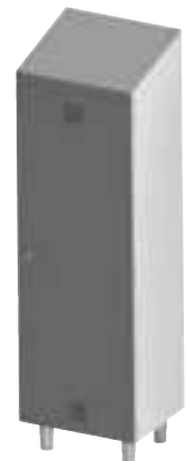
MAC06 + pieds inox (MAC06X)